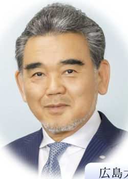
広島大学長 越智 光夫

広島大学東千田キャンパス 東千田未来創生センター401・402 (4階) 〒730-0053 広島市中区東千田町1-1-89